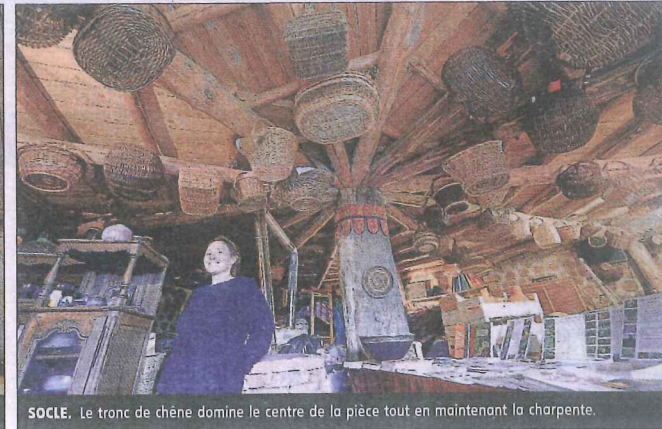
SOCLE. Le tronc de chêne domine le centre de la pièce tout en maintenant la charpente.