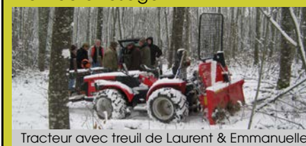
Tracteur avec treuil de Laurent & Emmanuelle.

Au final, nous avons acheté en 2007 un petit tracteur de pente Carraro modèle 4400 hst de 38cv. Il offre une très grande sécurité d'utilisation que nous avons parfaitement vérifiée à l'usage.